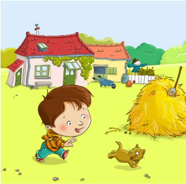
À la ferme, Fleurus presse