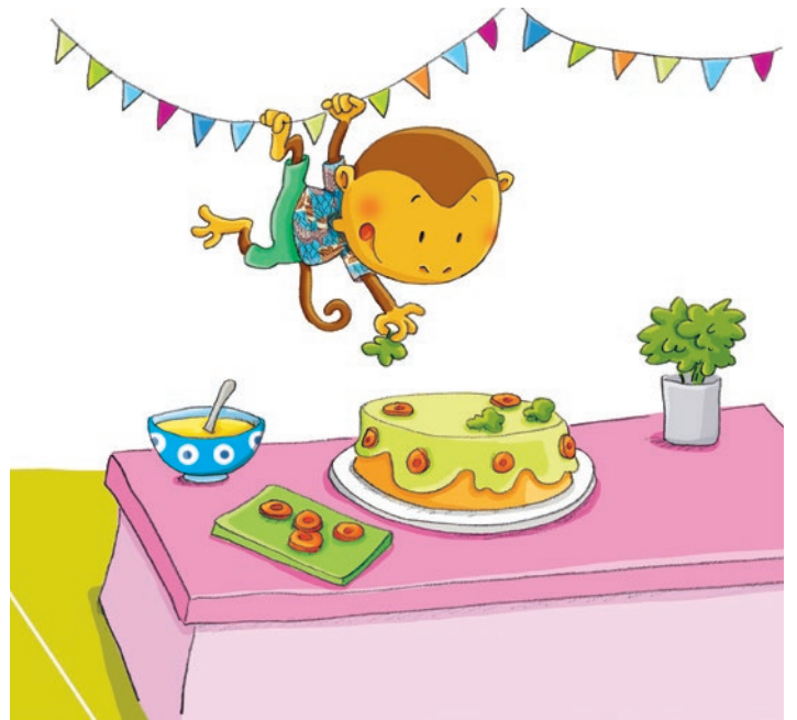
Singe, ABC diététique