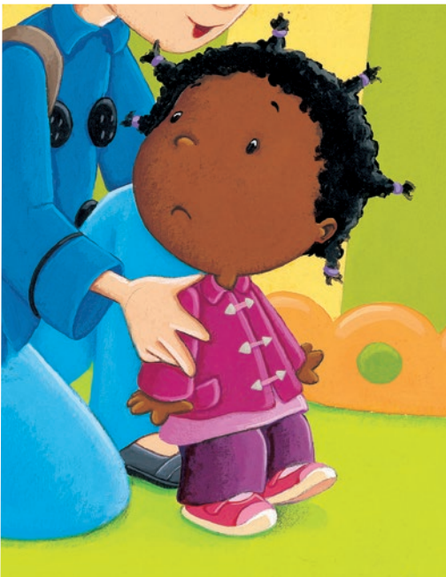
Yoyo J'aime le manège, Heuuuuu, Lito