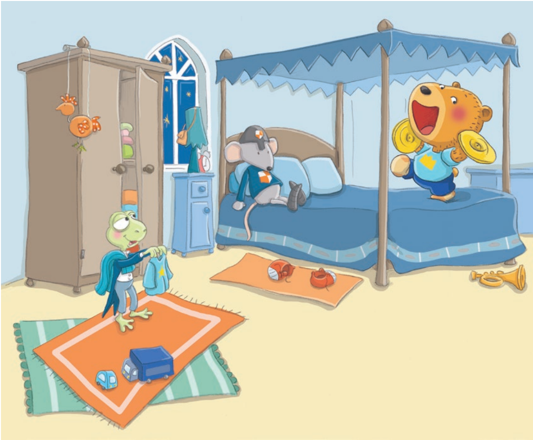
Le prince Igor ne veut pas dormir, DHP