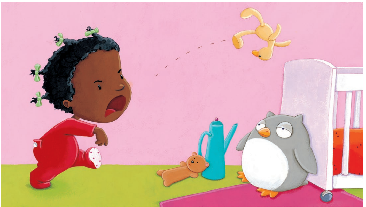
Yoyo Je ne veux pas dormir, Dodo canard, Lito

Une collection pour les tout petits, écrite par Susie Morgenstern Yoyo est une petite fille vraiment pas bien grande, qui vit à sa hauteur ses grandes aventures quotidiennes.