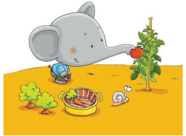
Eléphant, ABC diététique