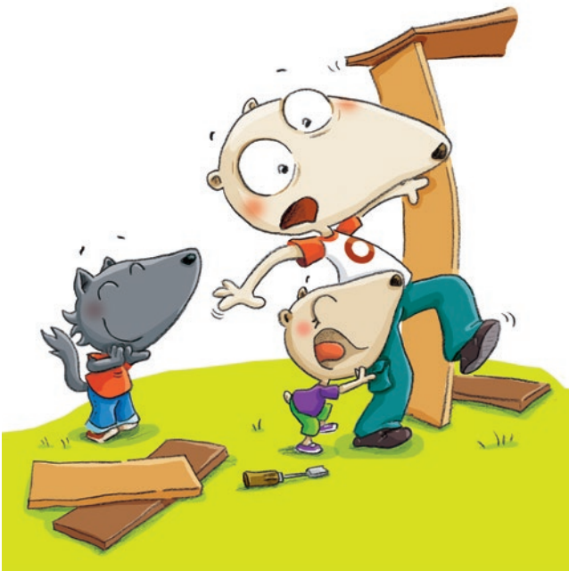
Louna et le spectacle de cirque, On y va aaa, Larousse