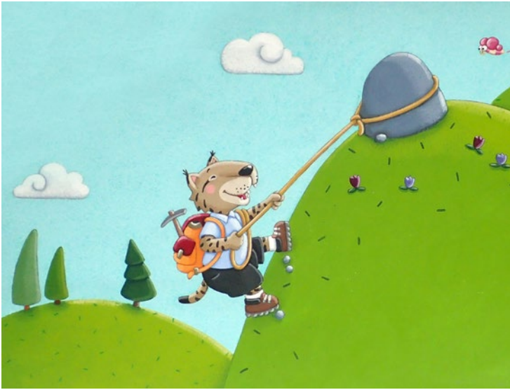
À la montagne, Milan Presse