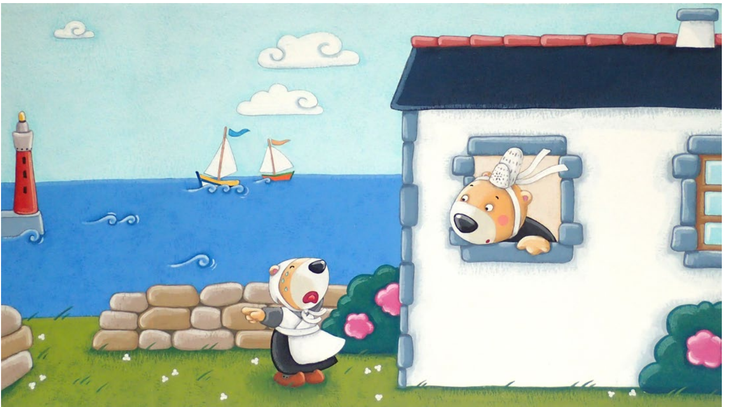
La pêche aux moules