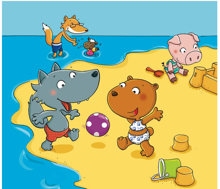
À la plage, Magnard