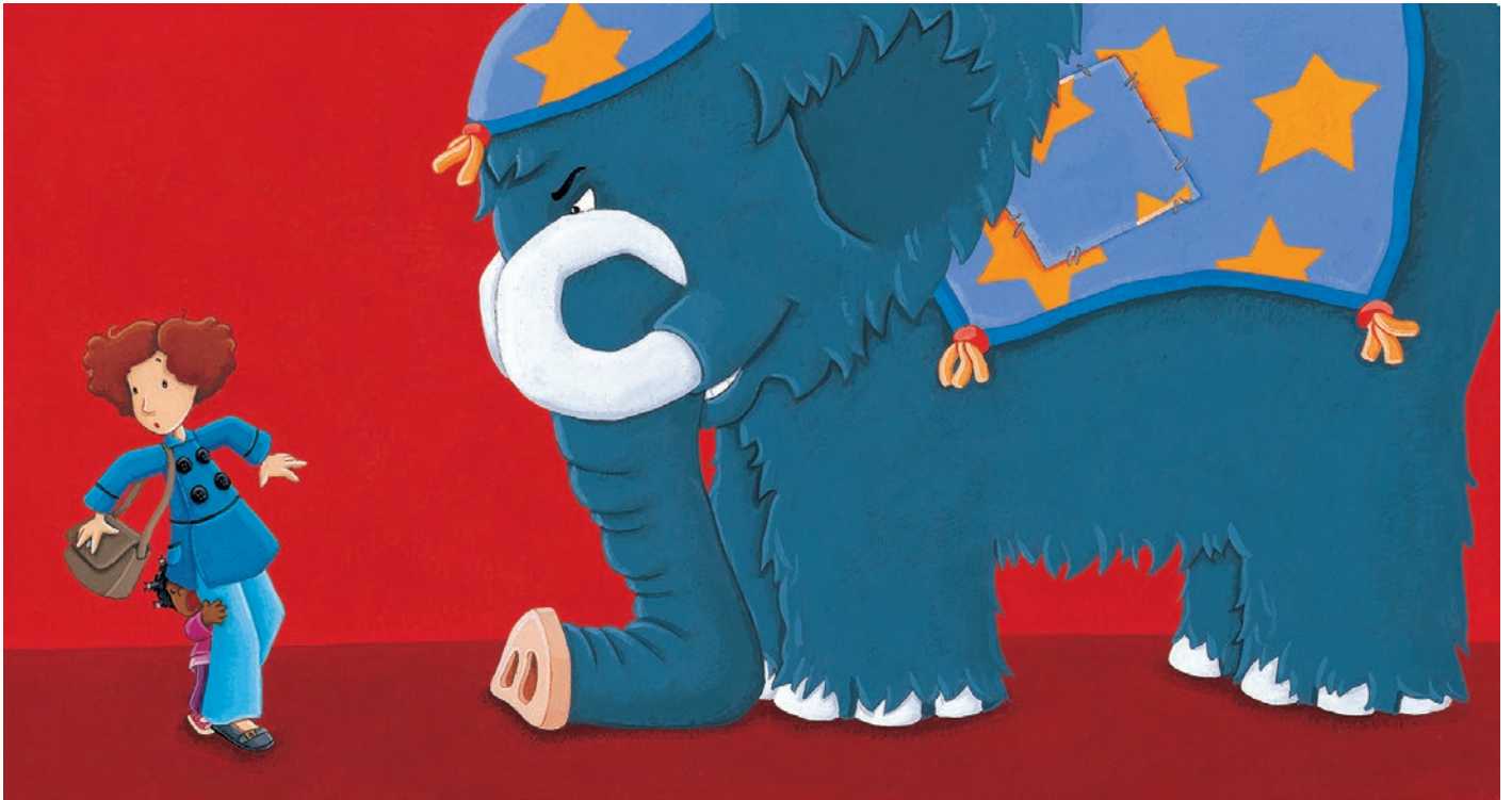
Yoyo J'aime le manège, Mammouth, Lito