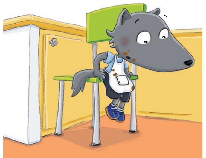
Louna et l'incroyable goûter, Moi j'ai plutôt un peu soif, Larousse