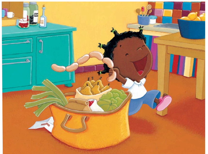
Je m'appelle Yoyo, Ma grande saucisse, Lito