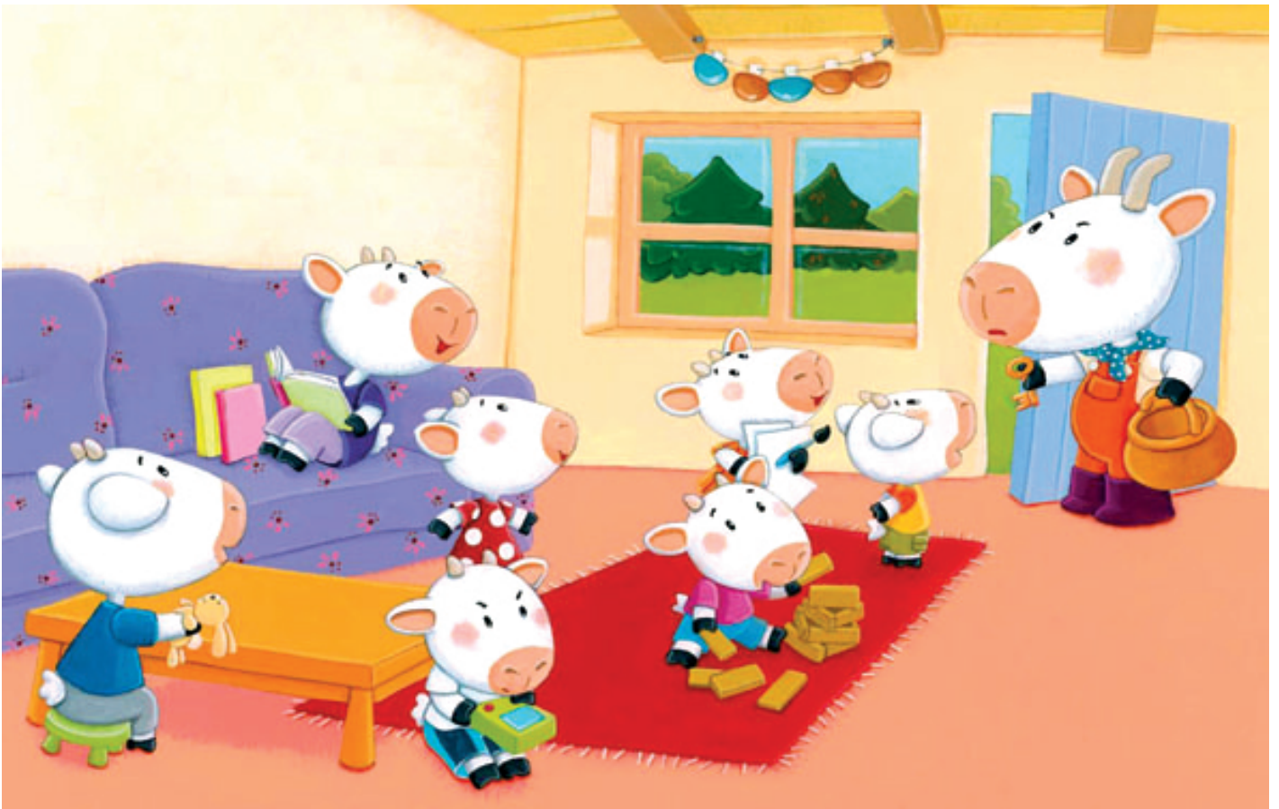
Le loup et les 7 chevreaux, Auzou