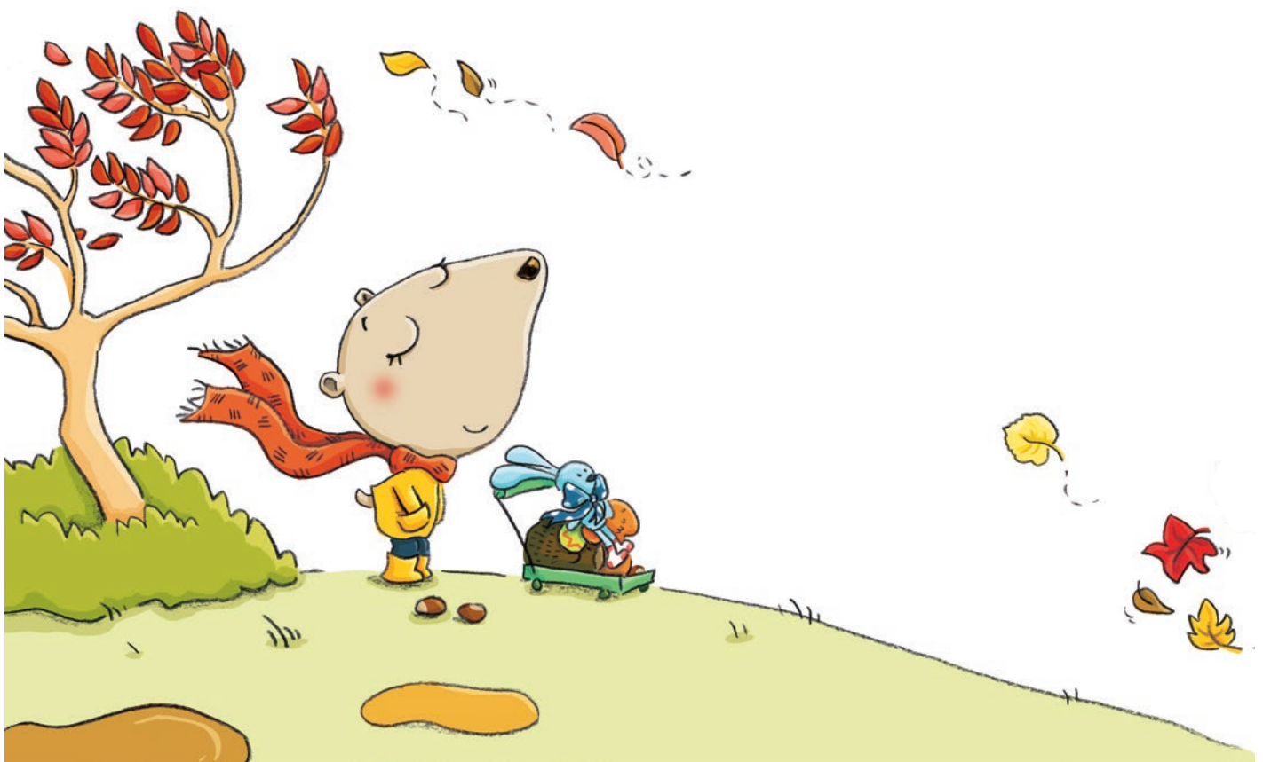
Louna et le préféré doudou, L'écharpe de Mima, Larousse

Une série pour les maternelles, écrite et illustrée par Marie Quentrec. Louna a des tas d'idées, deux copains, un papa, une maman, une mima, pas mal de doudous et puis encore des idées. Et elle se débrouille toujours pour les réaliser.